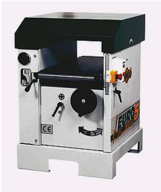
Obrázok 3: Hrúbkovacia frézovačka

Hrúbkovacia frézovačka je stroj, ktorý sa hrúbkuje (frézuje) zarovnaný materiál na presnú hrúbku jedným alebo dvoma vodorovnými nožovými hriadelmi. Nožové hriadele majú dva alebo viac nožov. Nožový hriadeľ sa otáča rovnomernou rýchlosťou proti smeru posúvaného materiálu. Materiál sa posúva do rezu podávacími valcami stroja. Hrúbkovacie frézovačky môžu byť jednostranne, dvojstranne alebo špeciálne.