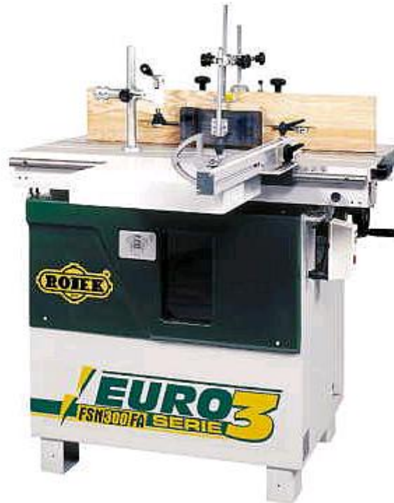
Obrázok 6: Spodná frézovačka