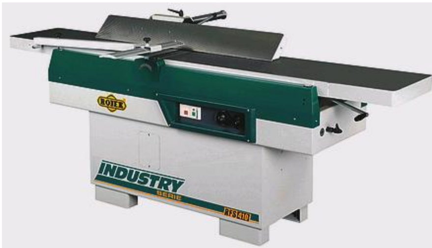
Obrázok 1: Zrovnávacia frézovačka

Zrovnávacia frézovačka je stroj, ktorý zrovnáva (frézuje) plochy dreva vodorovným nožovým hriadeľom (s dvoma alebo viac nožmi), otáčajúcim sa jedným smerom rovnomernou rýchlosťou. Materiál sa do rezu vedie ručne alebo strojovým posuvom. Zrovnávacia frézovačka je určená predovšetkým na zrovnávanie základnej plochy a bokov dosák alebo hranolčekov a na zrovnávanie plôch a bokov do určeného uhla.